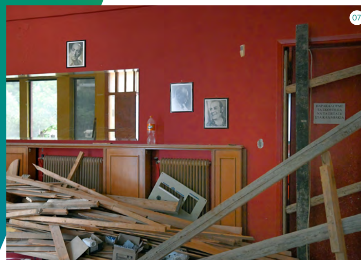
07 Πλήρης ανακαίνιση χώρου υποδοχής