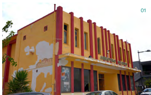
01 Πρόσοψη κτιρίου