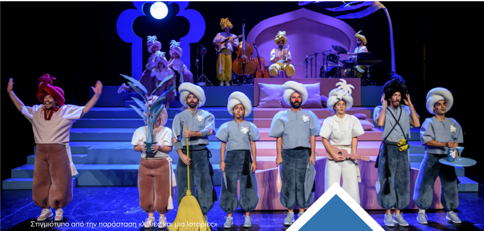
Στιγμιότυπο από την παράσταση «Χίλιες και μια Ιστορίες»