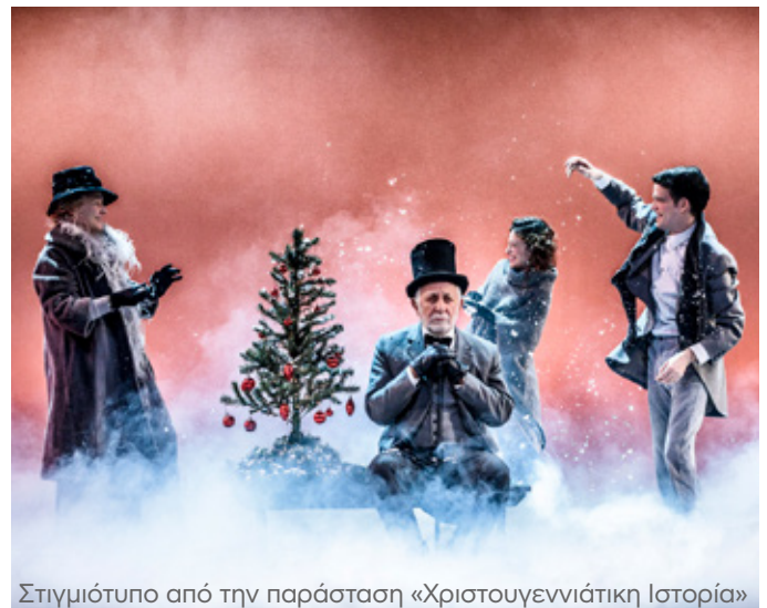
Στιγμιότυπο από την παράσταση «Χριστουγεννιάτικη Ιστορία»

Ένα μοναδικό θέαμα γιορτής και λάμψης που σαγηνεύει τις καρδιές όλων εκείνων που μπορούν ακόμα και βλέπουν τον κόσμο με την αθωότητα της παιδικής ψυχής είχαν την ευκαιρία να παρακολουθήσουν οι εργαζόμενοι των ΕΛΠΕ με τις οικογένειές τους. Μικροί και μεγάλοι αφέθηκαν στο όνειρο και στη φαντασία της κλασικής ιστορίας του Τσαρλς Ντίκενς , γοητεύτηκαν από το παραμυθιακό στοιχείο του έργου, συγκινήθηκαν και ίσως και να διδάχτηκαν με την αναδρομή του θρυλικού σκληρόκαρδου τραπεζίτη Εμπενέζερ Σκρουτζ στη ζωή του και τη σταδιακή συνειδητοποίηση των λαθών του.